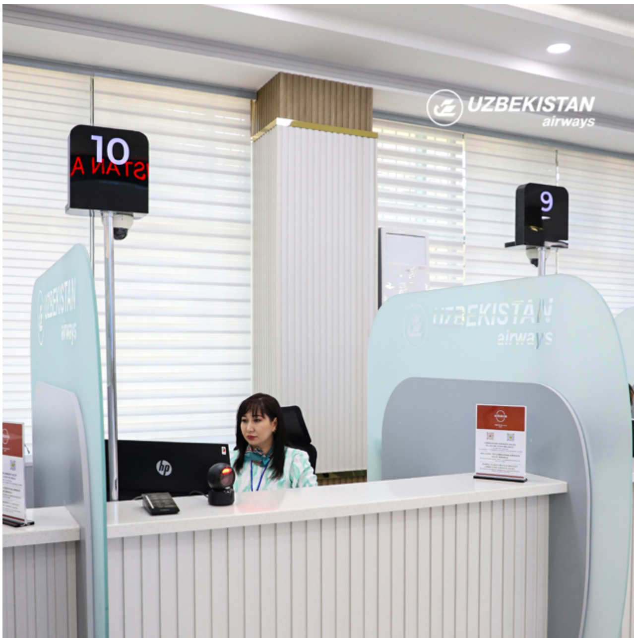
График работы Uzbekistan Airways Sales: с 08:00 до 20:00, без выходных и перерыва на обед.

Также напоминаем, что 16 ноября, старый офис Uzbekistan Airways Sales продолжит свою деятельность в ограниченном режиме в течение дня, обновленный офис начал свою деятельность полноценно с 12:00 16 ноября, после открытия.