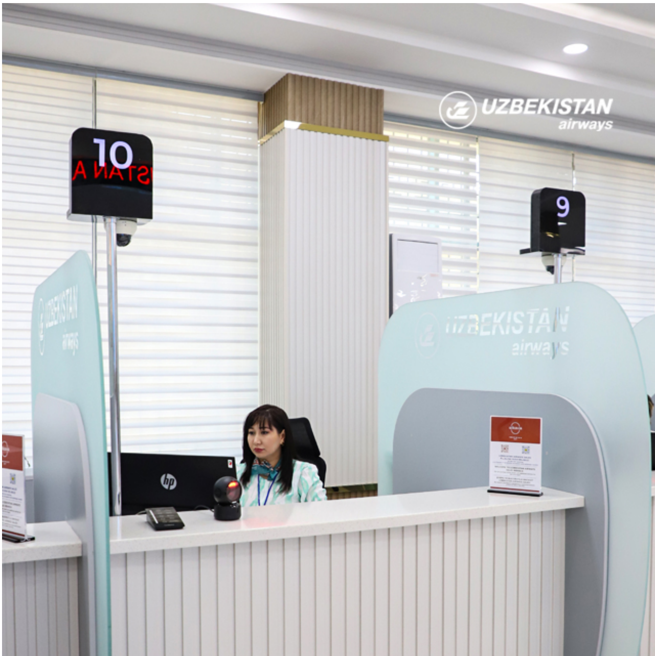
График работы Uzbekistan Airways Sales: с 08:00 до 20:00, без выходных и перерыва на обед.

Также напоминаем, что 16 ноября, старый офис Uzbekistan Airways Sales продолжит свою деятельность в ограниченном режиме в течение дня, обновленный офис начал свою деятельность полноценно с 12:00 16 ноября, после открытия.